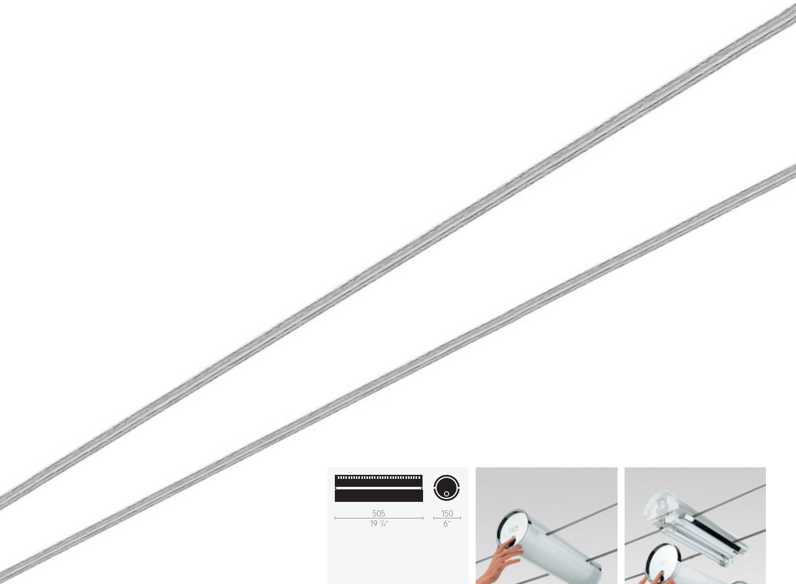
781 TensoEconomi soft opalescente