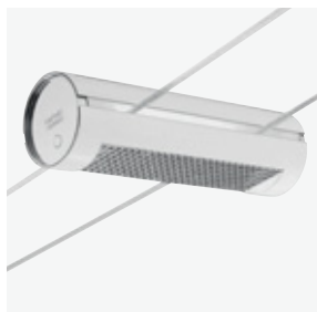
783 TensoEconomi dark bianco