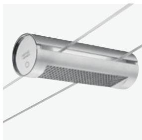
739 TensoEconomi dark argento