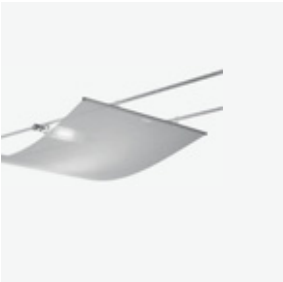
712 new TensoTeli