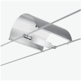
760 TensoCieli + new TensoGradi