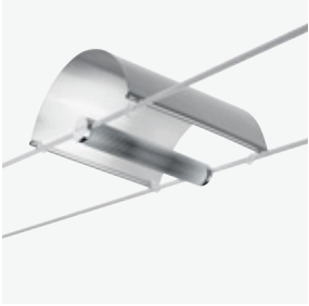
760 TensoCieli + TensoOnirico